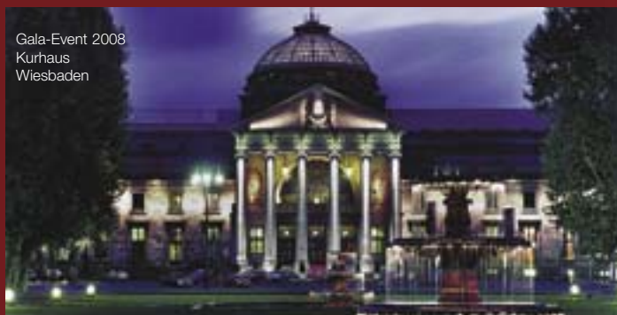
Gala-Event 2008 Kurhaus Wiesbaden