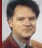
Hartwig Köster Pressel Versand GmbH